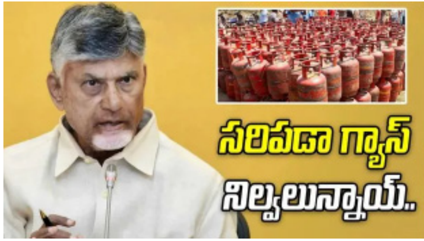
సరిపడా గ్యాస్ నిల్వలున్నాయ్..

అధికారులకు సీఎం సూచించారు. రాష్ట్రంలో ఇండక్సన్ స్టవ్ సైకిల్లను పెంచేలా చూడాలని ఆదేశించారు. గ్యాస్ కంపెనీలు స్వల్పకాలికంగా ఉత్పత్తి పెంచి, మెరుగైన పంపిణీ చేపట్టేలా చర్యలు తీసుకోవాలని సూచించారు.