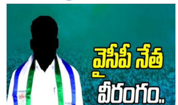
వైసీపీ నేత వీరంగం..