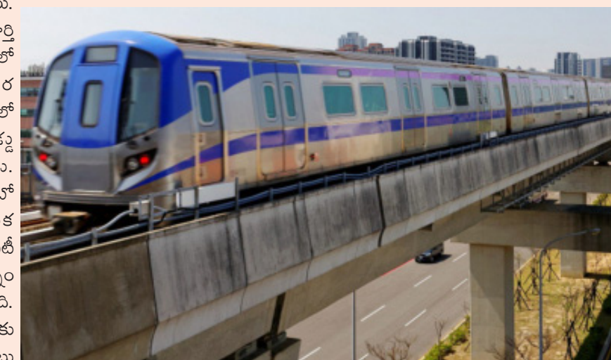
ప్రాజెక్టుకు కేంద్రం అనుమతులు ఇవ్వగా.. డీటెయిల్డ్ ప్రాజెక్టు రిపోర్ట్ (డీపీఆర్)ను తయారు చేయడానికి కేంద్రం నుంచి

అనుమతి రావాల్సి ఉంది. ఈ నేపథ్యంలోనే విశాఖ మెట్రో డీపీఆర్కు త్వరలోనే కేంద్రం నుంచి అనుమతులు రానున్నాయి. ఆ తర్వాత టెండర్లు పిలిచి పనులు ప్రారంభించనున్నారు. కేంద్ర, రాష్ట్ర ప్రభుత్వాలు కలిసి సంయుక్తంగా ఈ విశాఖ మెట్రో నిర్మాణాన్ని చేపట్టనున్నాయి.ఇందులో కేంద్ర ప్రభుత్వం తన వాటాగా కొంత మొత్తాన్ని కేటాయించేందుకు అంగీకరించింది. మరోవైపు.. విజయవాడ మెట్రోకు కూడా కేంద్రంలోని సరేంద్ర మోడి ప్రభుత్వం అనుమతులు ఇచ్చిన సంగతి తెలిసిందే. విజయవాడ మెట్రోకు త్వరలోనే సర్వే చేపట్టనుండగా.. ఆ తర్వాత డీపీఆర్ను తయారు చేసి ఆమోదం కోసం కేంద్ర ప్రభుత్వానికి పంపించనున్నారు.మరోవైపు.. హైదరాబాద్లోని టెలి రింగ్ రోడ్డు (ఓఆర్ఆర్) లాగానే విశాఖపట్టణంలో కూడా సెమి రింగ్ రోడ్డు నిర్మాణం చేపడతామని మంత్రి నారాయణ స్పష్టం చేశారు. ఈ సెమి రింగ్ రోడ్డు నిర్మాణం పూర్తి అయితే విశాఖలో ట్రాఫిక్ భారీగా తగ్గుతుందని పేర్కొన్నారు. సెమి రింగ్ రోడ్డు నిర్మాణానికి సంబంధించి వీఎండీఎ అధ్యయనం చేస్తోందని.. విశాఖ అభివృద్ధి కోసం హడ్కో సహకారం ముఖ్యమని మంత్రి తెలిపారు.కార్పొరేషన్లు, మున్సిపాలిటీలకు ఆదాయాన్ని సమకూర్చుకునే మార్గాలను అన్వేషించనున్నట్లు పేర్కొన్నారు. రాంబిల్లి-భోగాపురం ప్రాజెక్టును వీఎంఆర్డీపీ పరిశీలిస్తోందని తెలిపిన మంత్రి నారాయణ.. మాస్టర్ ప్లాన్ రోడ్లలో ఒక రోడ్డుకు అటవీ భూమి అద్దంగా ఉందని వెల్లడించారు. ముఖ్యమంత్రి నారా చంద్రబాబు నాయుడు.. డిప్యూటీ సీఎం పవన్ కళ్యాణ్లను కలిసి మాట్లాడి సమస్యను పరిష్కరించనున్నట్లు స్పష్టం చేశారు.