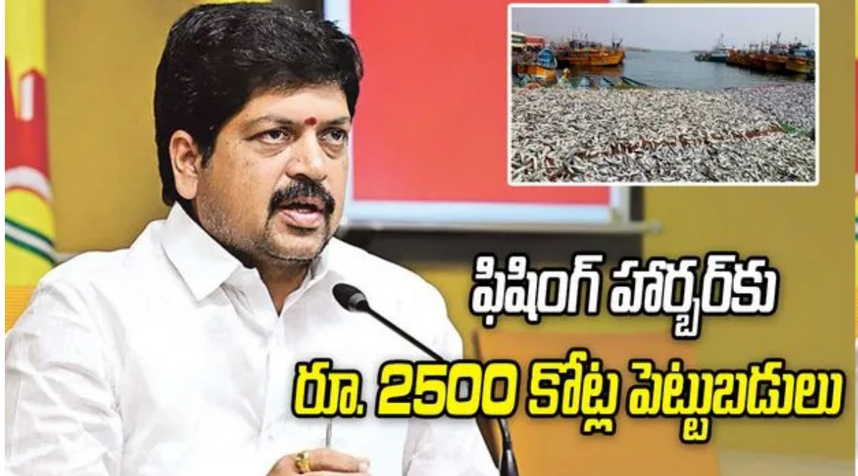
ఫిషింగ్ హార్బర్కు రూ. 2500 కోట్ల పెట్టుబడులు

ఏపీలో ఎక్కడా గ్యాస్ కొరత లేదని మంత్రి నాదెండ్ల మనోహర్(స్పష్టం చేశారు. 100 శాతం ప్రజలకు గ్యాస్ అందిస్తున్నామన్నారు. ఎవరూ ఆందోళన చెందాల్సిన అవసరం లేదని తెలిపారు. గతంలో ఫుడ్ సేఫ్టీ అధికారులు మున్సిపల్ శాఖ ఆధ్వర్యంలో ఉండేవారని.. ఇప్పుడు వారు ఆరోగ్యశాఖ కిందకు మారినట్లు చెప్పారు. ఫుడ్ సేఫ్టీ అధికారుల కొరత ఉందని... వాటిని త్వరలో భర్తీ చేస్తామని ప్రకటించారు. పీటీఎస్ బియ్యం అక్రమ రవాణాపై నిఘా పెట్టమన్నారు. ఎక్కడ అక్రమ రవాణా జరుగుతున్నా ఉక్కుపాదం మోపుతున్నామని మంత్రి నాదెండ్ల మనోహర్ వెల్లడించారు.