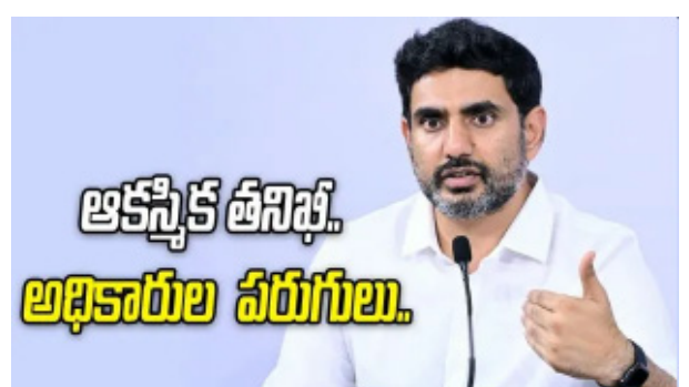
ఆకస్మిక తనిఖీ.. అధికారుల పరుగులు..

విజయవాడ, మార్చి 18: మైలవరం ప్రభుత్వ పాఠశాలలో విద్యార్థులకు నాసిరకం భోజనం అంటూ ఆరోపణలు వెల్లువెత్తాయి. ఈ నేపథ్యంలో ఆంధ్రప్రదేశ్ ఐటీ, విద్యా శాఖ మంత్రి నారా లోకేశ్ స్వయంగా రంగంలోకి దిగారు. మంగళవారం ఎన్టీఆర్ జిల్లా మైలవరంలో తారక రామానగర్లోని మండల పరిషత్ ప్రాథమిక పాఠశాలను ఆయన ఆకస్మికంగా తనిఖీ చేశారు. ఈ సందర్భంగా పాఠశాలలో వడ్డిస్తున్న భోజనంపై విద్యార్థులను మంత్రి లోకేశ్ ఆరా తీశారు. 'భోజనం రోజూ బాగావడం లేదా? ఆ ఒక్క రోజే బాగాలేదా?' అంటూ విద్యార్థులను ఈ సందర్భంగా ప్రశ్నించారు.